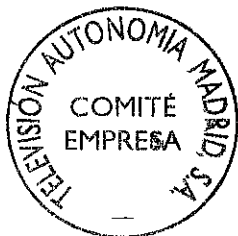
Comité de TVAM

La millonaria inversión pública en medios técnicos de nuestra empresa debe ser utilizada para recuperar una Radio Televisión Pública al servicio de la sociedad madrileña