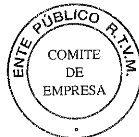
Comité de EPRTVM