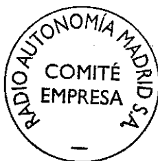
Comité de Onda Madrid